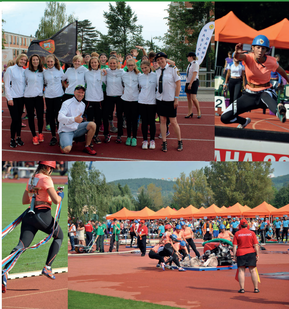
Dalovické hasičky reprezentovaly kraj na MČR v požárním sportu více viz. strana 6

Vydává Obec Dalovice | ZDARMA | 7/2017 | září 2017