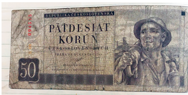
50korunová bankovka, která platila na území ČSR do měnové reformy v r. 1953 (do obecní kroniky vlepená r. 1961)

Při výměně peněz asistovali příslušníci Sboru národní bezpečnosti (SNB) a příslušníci Lidových milicí.