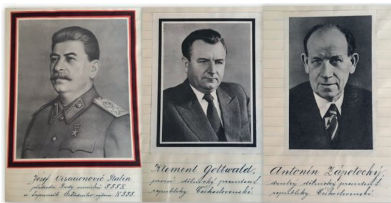
Fotografie z obecní kroniky, r. 1953: J. V. Stalin, K. Gottwald a A. Zápotocký

dne 21. 3. 1953 nového prezidenta Antonína Zápotockého. Do čela republiky se tak postavil druhý dělnický prezident.