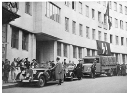
Sídlo bezpečnostní policie a Gestapa v K. Varech (dnešní ulice I. P. Pavlova, bývalé policejní komisařství)

školní budovy čp. 120, v hostinci W. Loha čp. 69 a v Zámecké restauraci čp. 85 zůstaly v obci až do června, kdy byly postupně lazaretními vlaky z dalovického nádraží odváženy Mezinárodním červeným křížem do Bavorska. Německé vojsko při svém ústupu přes Slovensko přivezlo s sebou různé stroje z továren, hospodářské stroje, motorky, nábytek, látky apod., které tam zabralo,