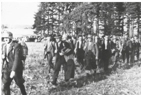
Volkssturm (německá lidová domobrana) kdesi na Karlovarsku, duben 1945