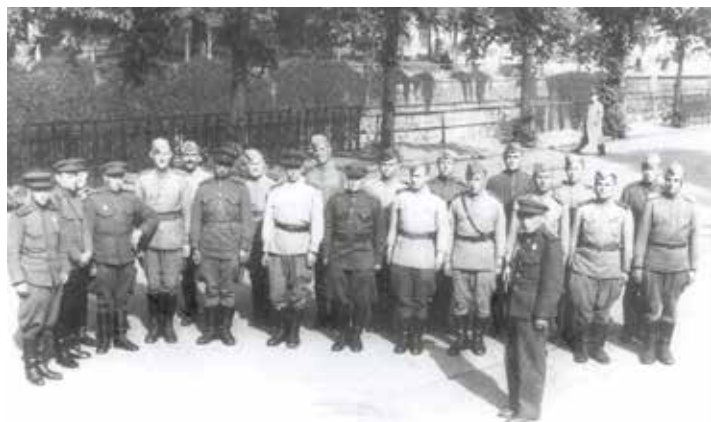
Sovětské vojáky před Vojenským lázeňským ústavem, květen 1945

Začátkem června projela Rudá armáda několikrát Dalovicemi, ale nezdržela se. Až 12. 6. 1945 se do Nového zámku nastěhovalo oblastní velitelství Rudé armády. Velká část Rudé armády (RA) se pak z Karlových Varů do Dalovic přestěhovala 10. 7. 1945. Vojsko obsadilo všechny domy v ulici Pod Strání a v dnešní Májové