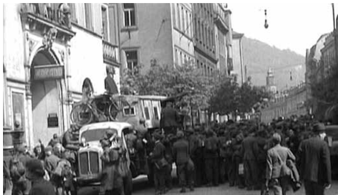
Poválečný chaos před Národním domem v K. Varech, květen 1945